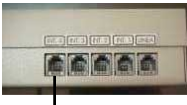
Interno 4: Los dos hilos interiores para conexión de interno Los dos hilos exteriores para conexión de portero a 2 hilos

El portero a dos hilos suena en los telefonos pero no tiene abrepuertas.